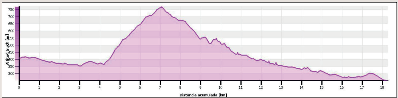
Gràfica de la ruta