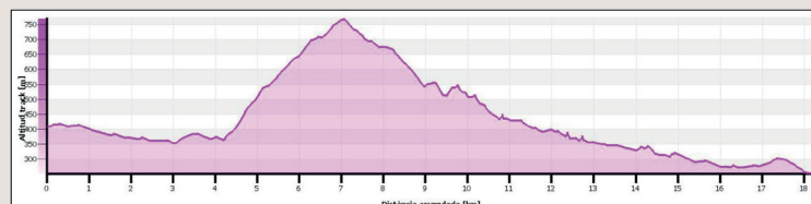
Gràfica de la ruta