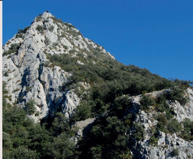
Salt dels Lliberals

Travessem un tram molt bac on la pista queda uns quants metres per damunt de la riera. Quan l'engorjat s'eixampla, arribem al pont Trencat o de cal Xicot. Deixem el camí d'Escales a mà dreta i seguim la pista que es comença a enfilar. Aigües avall, la riera d'Oix s'ajunta amb la de Beget i formen la riera d'Escales.