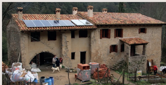
Reforma del nou refugi de Sant Aniol d'Aguja

Som en un dels trams més estrets d'aquest enyorjat, el passant d'en Roca. Caminem entre espadats on a vegades podem veure escaladors. Passem Castell s'Espasa -nom del monticle que ens queda a la dreta. Després d'aquest punt ens trobem entre dues rieres que ja coneixem: la d'Escales i la de Sant Aniol. Tornem a creuar la riera, ara pel pont dels Aures, d'on surt un dels camins per anar a la Cova del Bisbe. Una mica més avall hi ha l'aiguabarreig de les dues rieres esmentades, que formen el Riu Llierca.