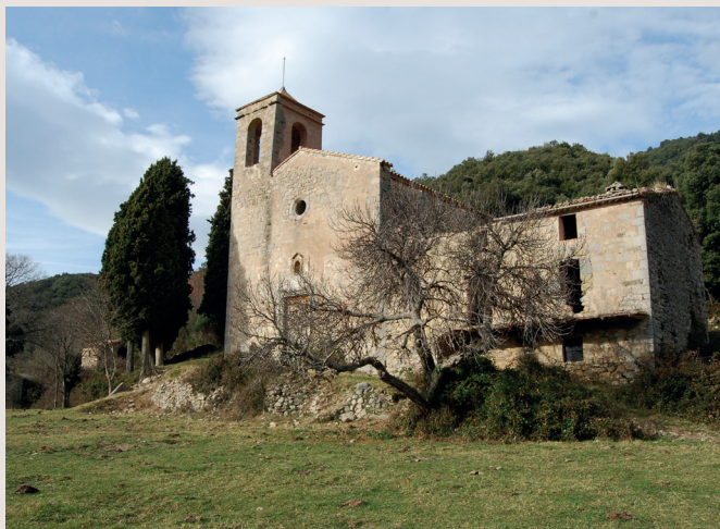
Sant Martí de Talaixà

El camí, ben fresat, continua per l'alzinar, travessa un antic torrent i, poc abans d'arribar a Talaixà, en una de les ziga-zagues, s'acosta a un caire on val la pena acabar d'arribar per gaudir de la vista: cresta del Ferran, Bestrecà, Montpetit, Montmajor... Arribem al coll de Talaixà, on una banderola amb molts senyals ens recorda que és un important encreuament de camins.