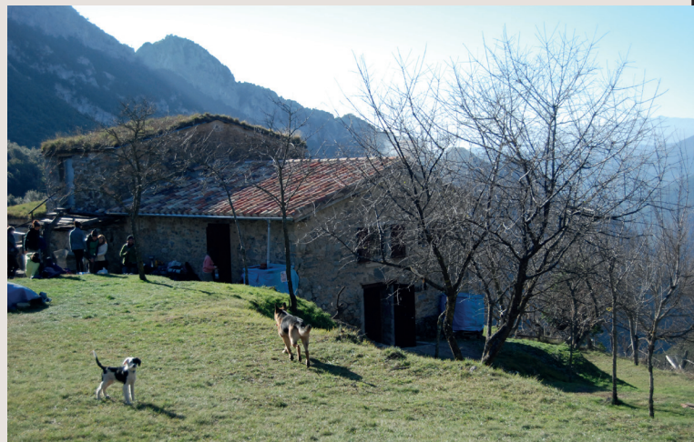
Casa Refugi de Talaixà

Tornem a la cruïlla de camins, on agafem el que va a Sant Aniol. Passem pel que queda de l'antic casal de la Quera. En aquest camí, tant abans com després de la casa, s'hi conserven alguns trams empedrats, alguns arcs i parets que són veritables obres d'arquitectura civil. Prop de la Quera cal deixar la pista i agafar un caminet que va cap a l'esquerra; el seguim pla i avall, fins que trobem un altre encreuament de camins: el de la dreta ens portaria a la Muntada i a la riera de Sant Aniol; nosaltres continuem pel de l'esquerra.