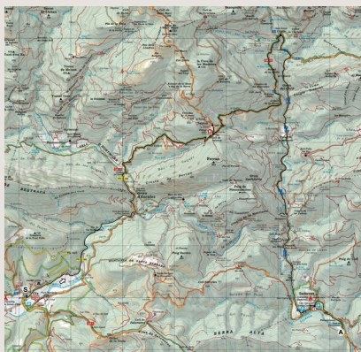
Mapa de l'itinerari