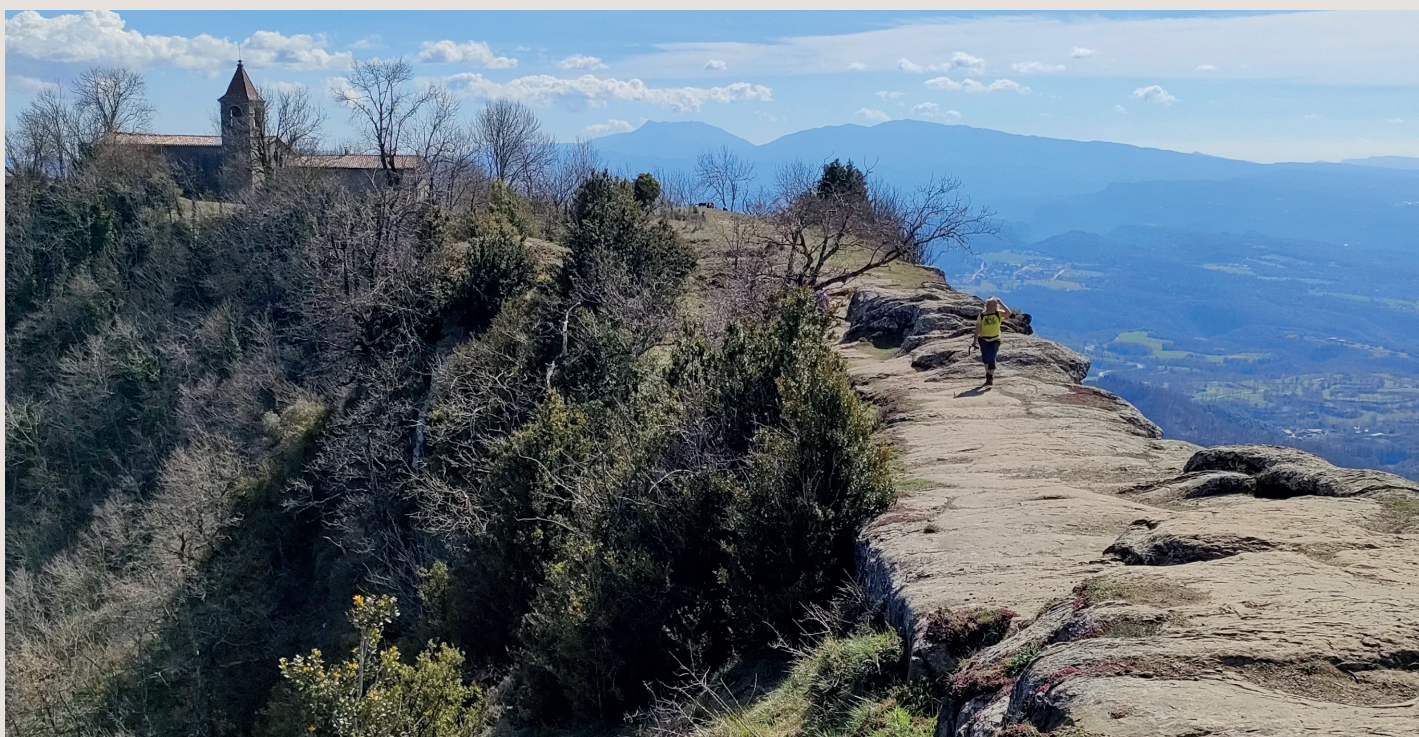
A dalt del Santuari de la Mare de Déu de Cabrera

Estret. Ara continuem per un fresat camí enmig de fajos i roures fins a l'anomenat "Estret" (1.190 m), bretxa oberta a la roca per evitar el pas de l'obaga del Puig dels Llops, plena de neu a l'hivern.