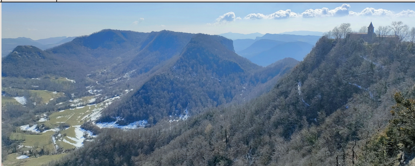
Cingles d'Aiats i, a la dreta, el Santuari de la Mare de Déu de Cabrera

El Collsacabra és un altiplà que forma part de la Serralada Transversal on predominen les formes tabulars de cims horitzontals vorejats de cingleres vertiginoses, paradís dels voltors. Aquestes cingleres de roques calcàries són fruit de l'erosió del riu Ter i de les fractures creades després de la formació dels Pirineus. Destaquen les plataformes de Cabrera (1312 m) i d'Aiats (1306 m), les quals visitarem durant la nostra ruta. La seva estructura d'altiplans acabats en espectaculars cingleres fan que les vistes siguin en tot moment esplèndides.