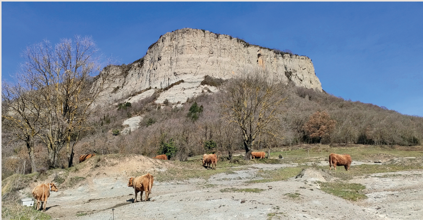
Cingles d'Aiats des de prop del Coll del Bac

Després del Collet de Comajoan desapareix l'asfalt i continuem amb una curta pujada per pista de terra. En creuar el pas canadenc, ens enfilem lleugerament a l'esquerra per un camí al mig d'avellaners i roures. Aquest camí va rodejant la base dels cingles d'Aiats i es converteix en una abandonada pista forestal que travessa una ombrívola fageda.