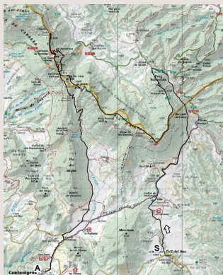
Mapa de l'itinerari