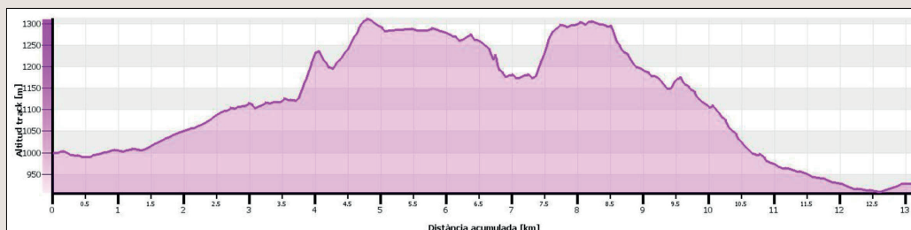
Gràfica de la ruta