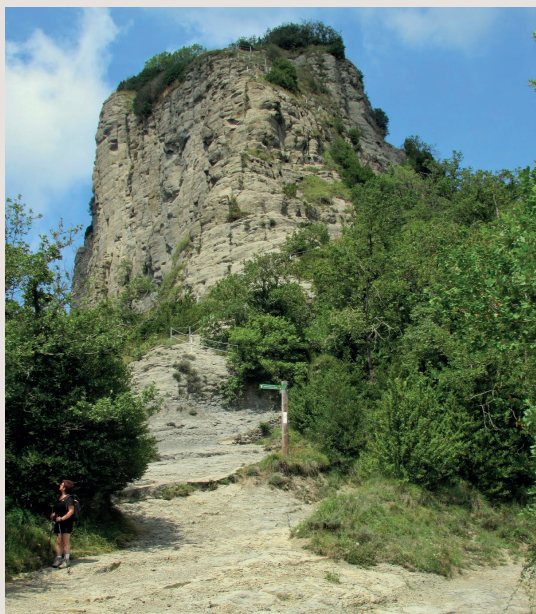
Les Escales de Cabrera

Un cop arribats a la base del petit funicular, seguim per pista de terra fins a arribar de nou al Coll del Bram, lloc on la deixarem i continuarem per un ample camí seguint les indicacions de "Cantonigròs".