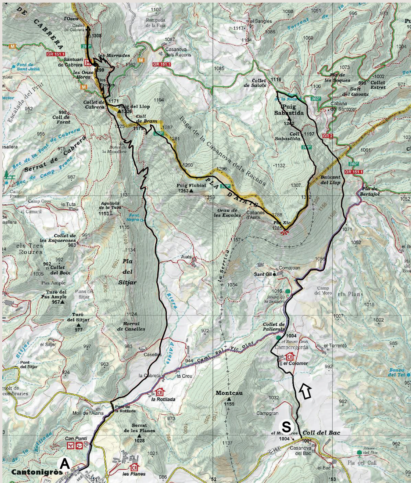
Mapa de l'itinerari