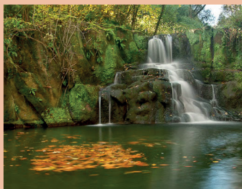
Gorg de Can Cutilla