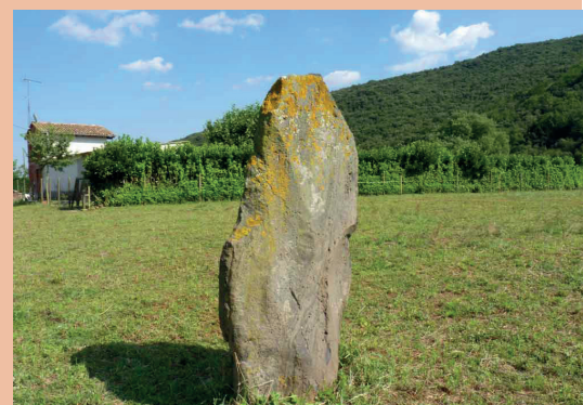
Pedra del Diable