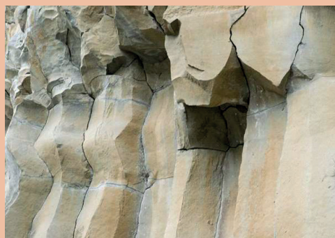
Detall de les tres colades