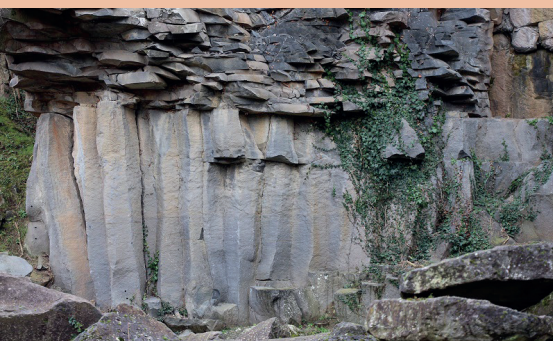
Les tres colades