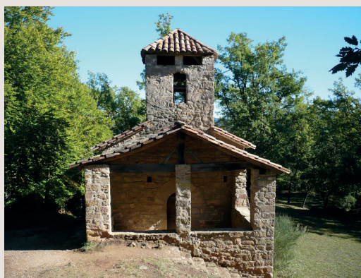
Ermita de Sant Miquel

Coordina: Centre Excursionista de Catalunya