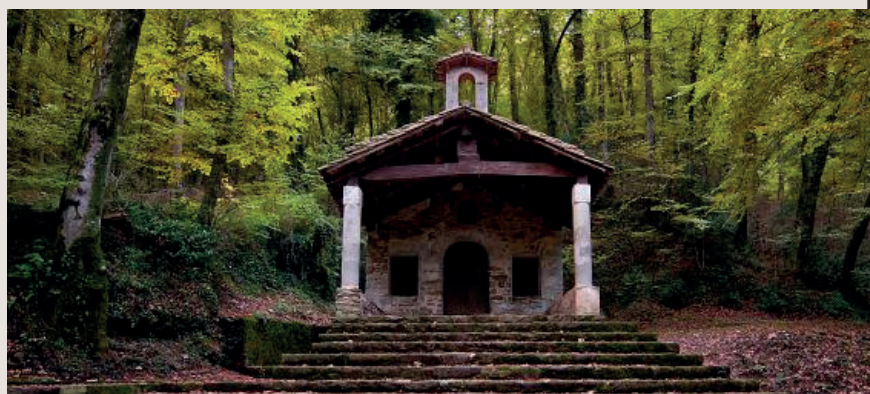
Ermita de Sant Martí del Corb